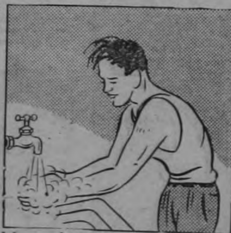
Lávese siempre antes de comer o de regresar a su casa.

Para muchos serán simples advertencias; para otros serán verdaderas lecciones que aprovecharán en su propio bien y en el bien de sus compañeros.