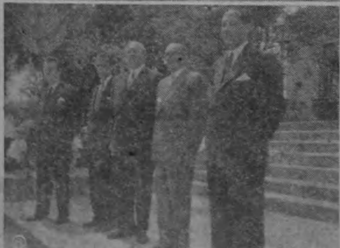
Delegaciones concurrentes a la Reunión Extraordinaria de Cancilleres que se llevó a cabo el jueves, a convocatoria del Presidente Ulate: 1) Delegación de Costa Rica, con el Jefe del Estado y los Ministros; 2) Delegación de El Salvador, que fué una de las más numerosas; 3) Delegación de Nicaragua, que siguió en importancia numérica a la de El Salvador; 4) Delegación de Honduras; 5) Observadores de Panamá.