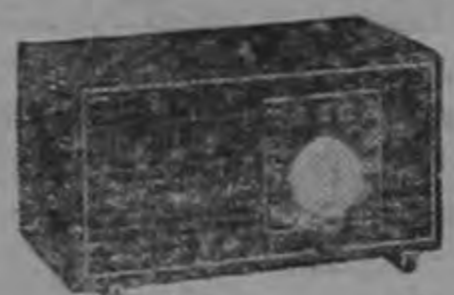
Modelo PHILCO 560 Real calidad y lujoso estilo... parlante dinámico... antena integrante... en atractivo, moderno gabinete de ébano, marfil o caoba.

No hay mejor sonido que el del Radio Philco