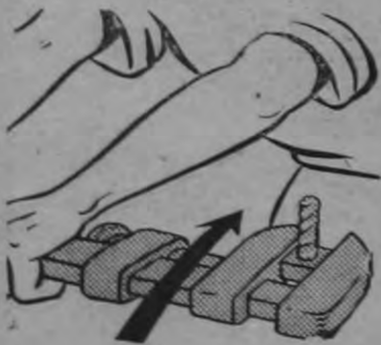
Coloque la boca de las mordazas de su llave en la dirección en que hace el tiro.

ESTA es una serie de publicaciones dedicada a la Seguridad de los Trabajadores, cualquiera que sea su ocupación.